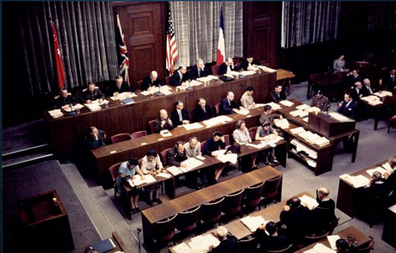
Międzynarodowy Trybunał Wojskowy w Norymberdze