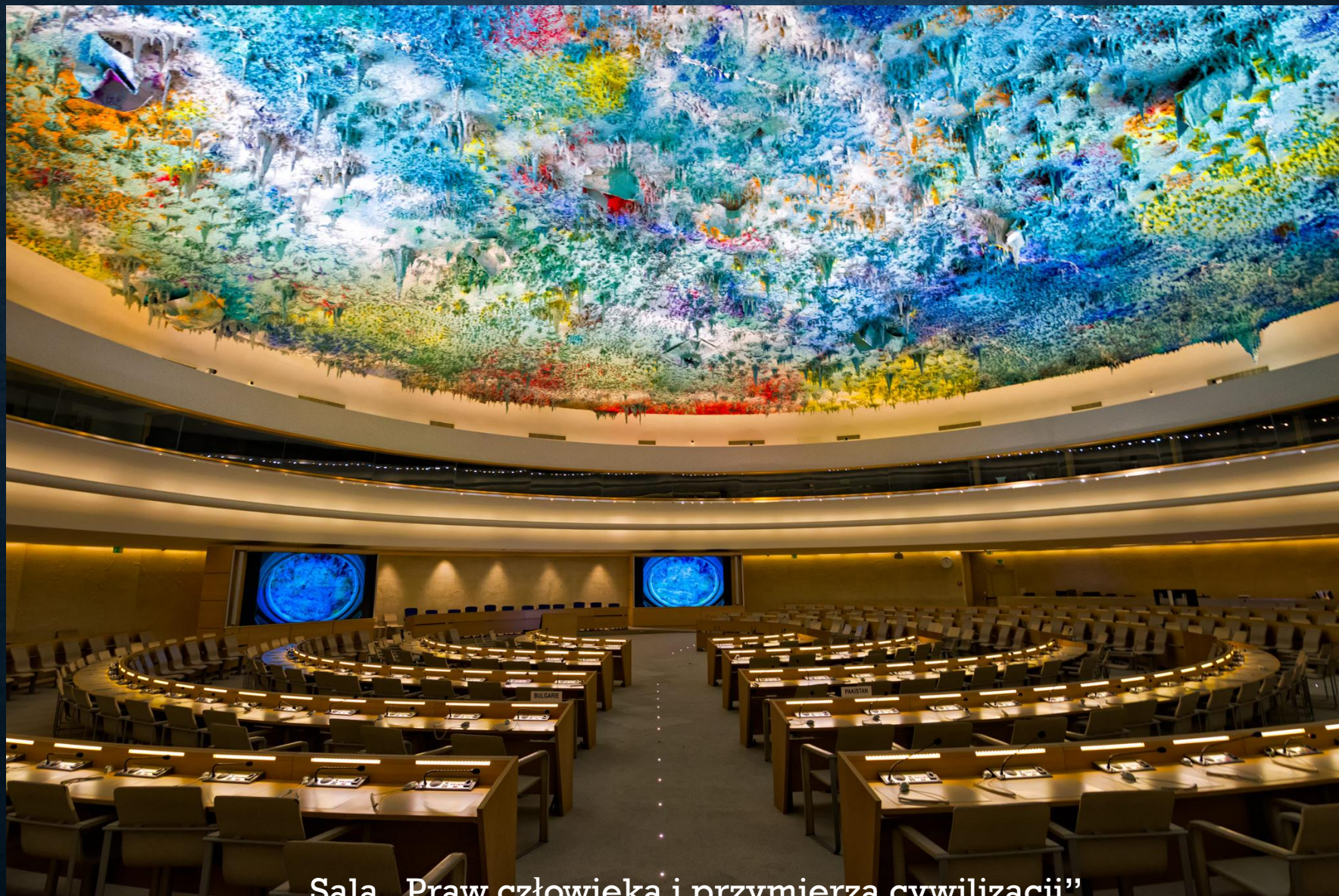
Sala „Praw człowieka i przymierza cywilizacji”