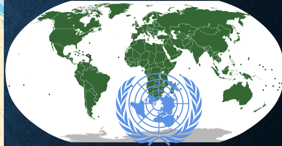
Organizacja Narodów Zjednoczonych